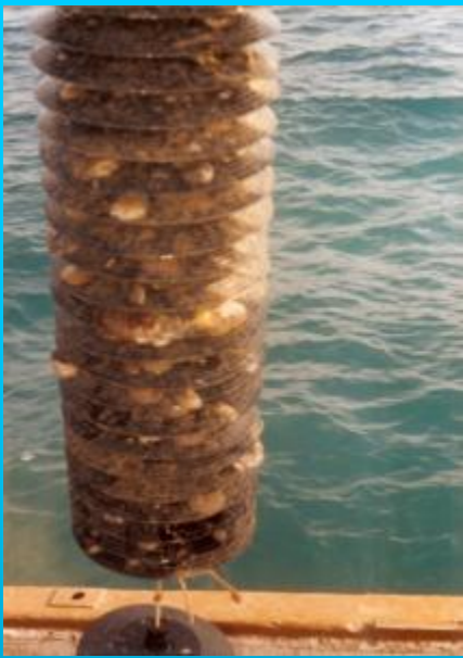
Captación Santa Pola