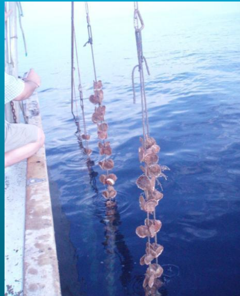
Cuerdas en long lines