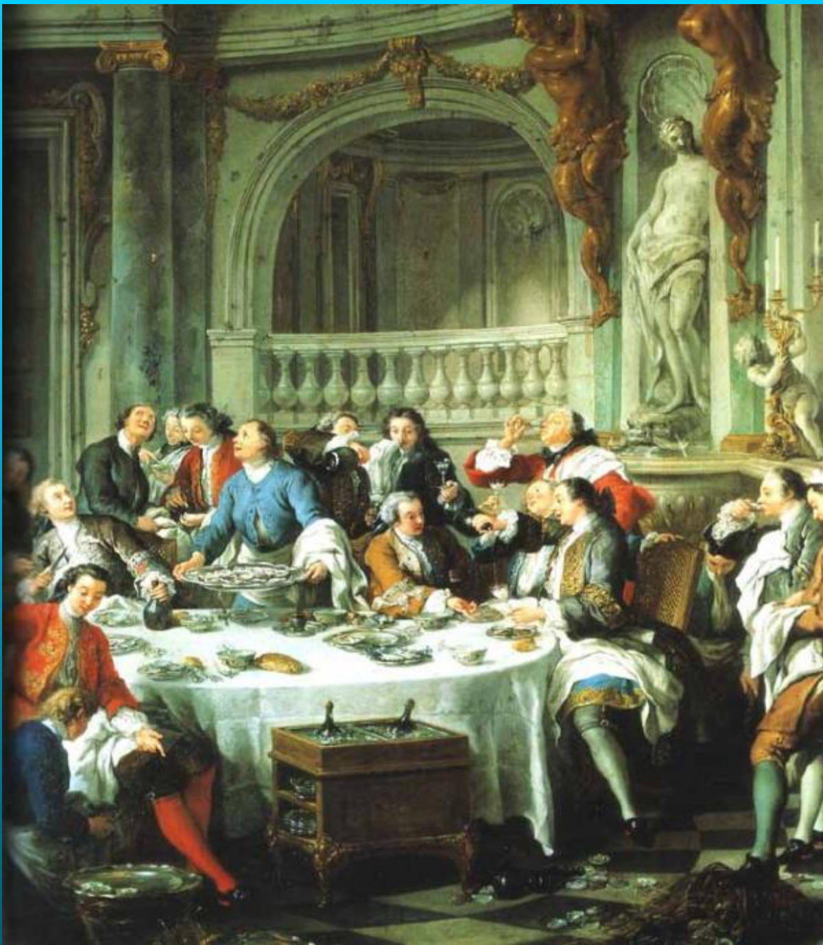
Le Déjeuner d'huîtres Jean-François de Troy