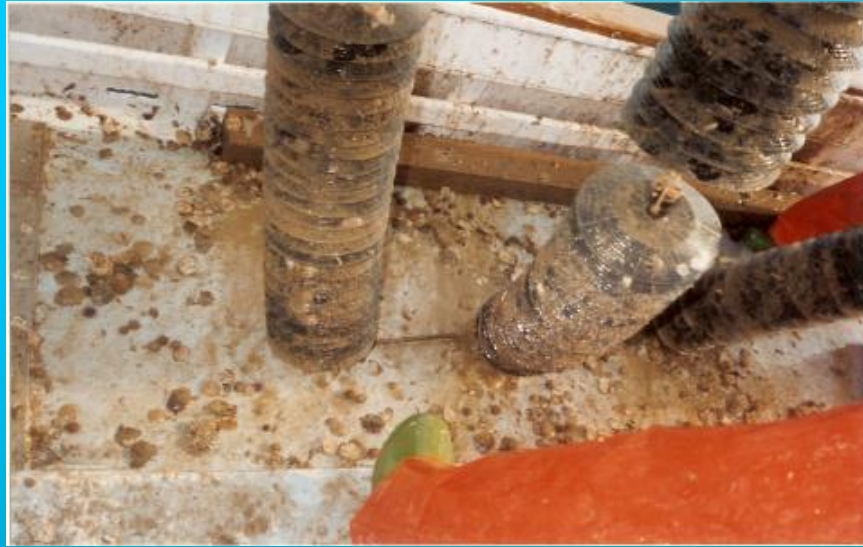
Detalle semilla despegada