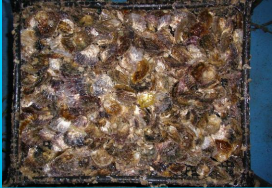
Cesta de cultivo antes del desdoble