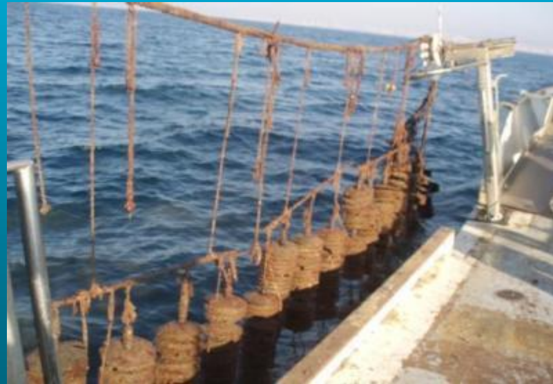
Colectores en el mar