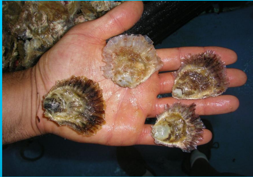
Semilla antes del desdoble