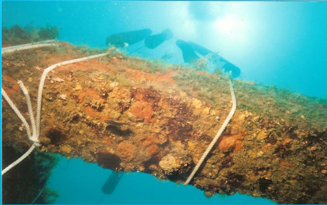
Ostras en su medio natural la Bahía de Santa Pola